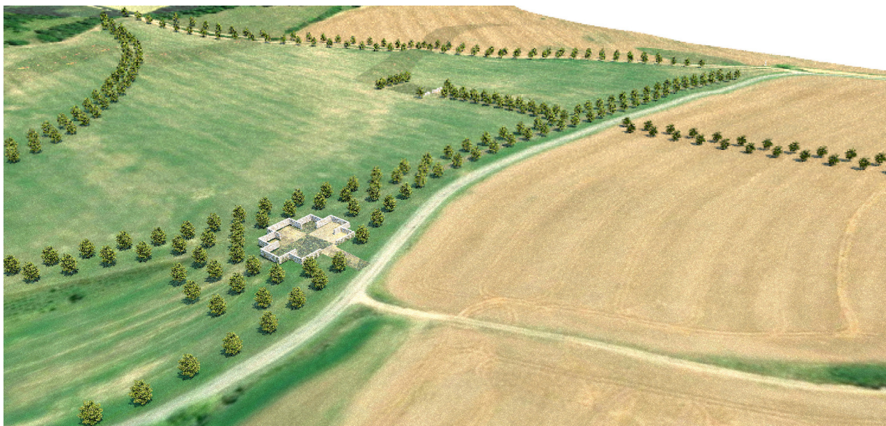
Vizualizace možné podoby kompostárny jako jednoho z prvků kulturní krajiny (archislužba.cz)

Předkládané řešení dílčí změny Z5/5 je z hlediska ochrany ZPF a ostatních zákonem chráněných obecných zájmů nejvýhodnější zejména z následujících důvodů: